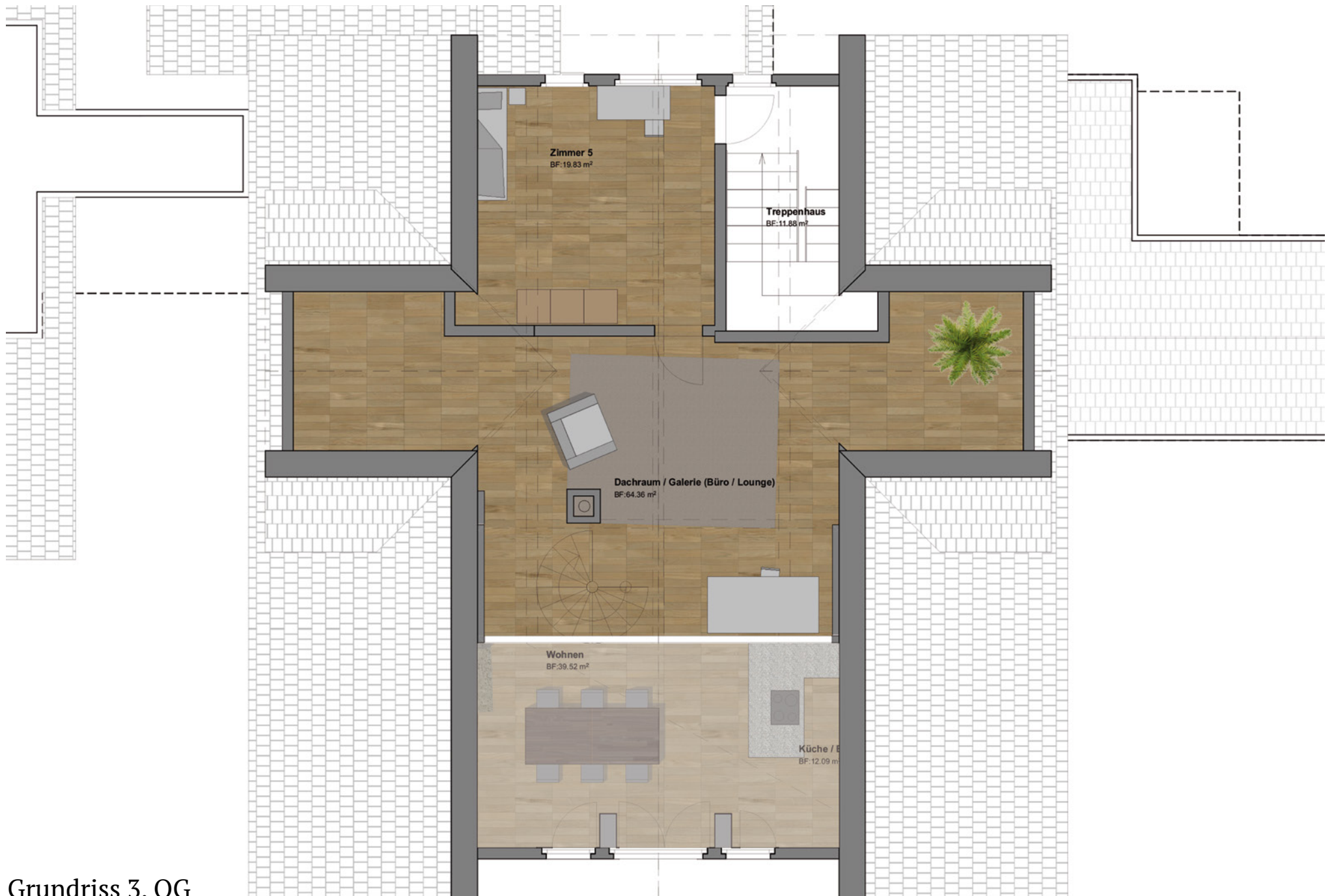
Grundriss 3. OG